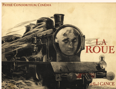
La Roue. Livret-programme illustré, 1923.

La Roue d'Abel Gance sorti en 1923. Un chef-d'œuvre qui mêle intrigue mélodramatique et monde ferroviaire.