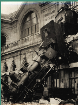
Accident de la gare Montparnasse en 1895.

Hugo Cabret de Martin Scorsese, 2011. Plongée dans les entrailles d'une gare du Paris des années 1930 ! Hommage à Georges Méliès et clin d'œil aux frères Lumière.