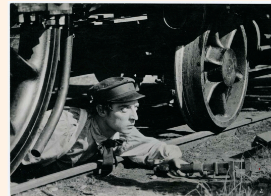
Le Mécano de la « General » , 1926.