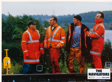
The Navigators, 2001.

Placés sous les projecteurs, les hommes du rail donnent l'image d'une corporation solidaire.