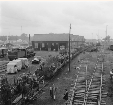
Le Train de John Frankenheimer. Photographie de tournage (1964).

Le Train (The Train) de John Frankenheimer, 1965. Un résistant cheminot veut éviter à tout prix l'acheminement d'œuvres d'art spoliées vers l'Allemagne. Une superproduction hollywoodienne tournée en France.