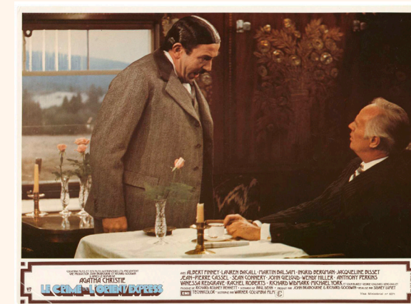
Le crime de l'Orient-Express, 1974.

Le crime de l'Orient-Express (Murder on the Orient-Express) de Sidney Lumet, 1974. Une enquête d'Hercule Poirot pour débusquer le meurtrier à bord de ce train mythique.