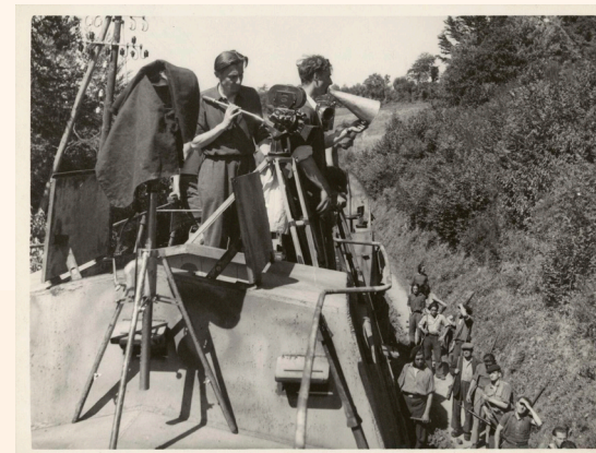
La Bataille du rail . Photographie de tournage (1945).

Depuis son entrée en gare de la Ciotat sur la pellicule des frères Lumière, le train inspire le septième art. Il serait vain de citer tous les films français et étrangers qui l'évoquent. Si La Bataille du rail , Le crime de l'Orient-Express sont des incontournables, d'autres moins connus du grand public méritent quelques minutes d'arrêt. Une exposition du Fonds cheminot vous invite à découvrir ou redécouvrir une vingtaine de ces films.